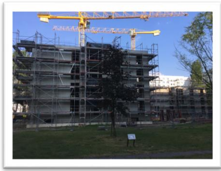
Nachverdichtung in Lichtenberg