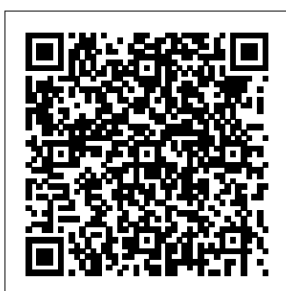
Link als 2D Barcode für Handy